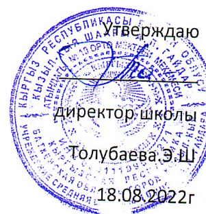
График проведения предметных недель на 2022-2023 учебный год